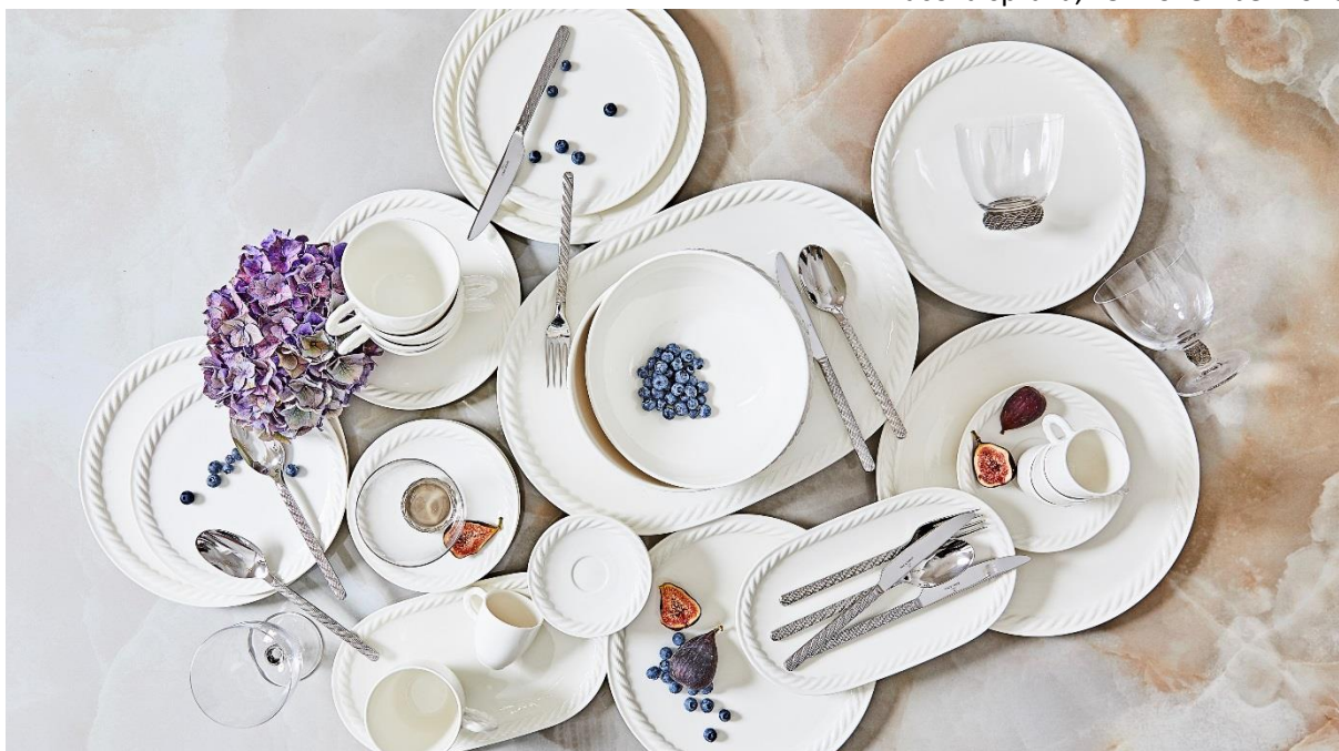
Fot. Porcelán Villeroy & Boch