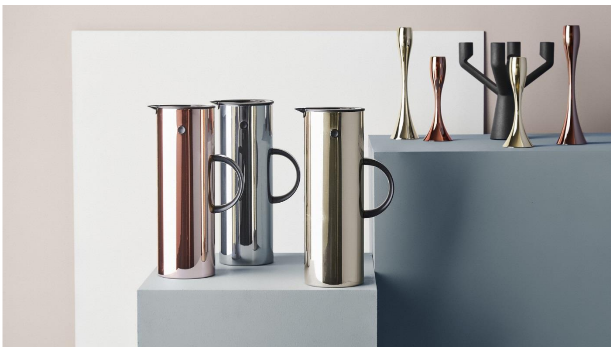
Fot. Kuchynské doplnky a dekorácie Stelton