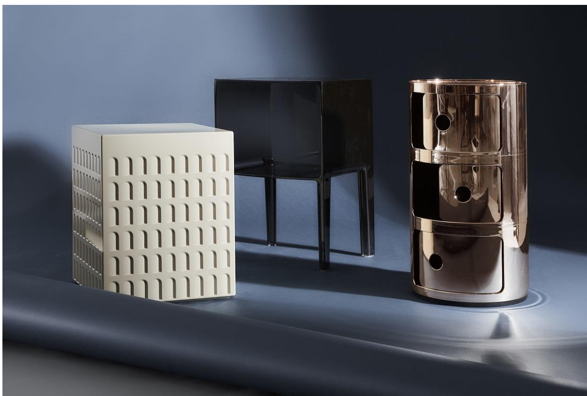
Fot. Konferenčné stolíky Kartell