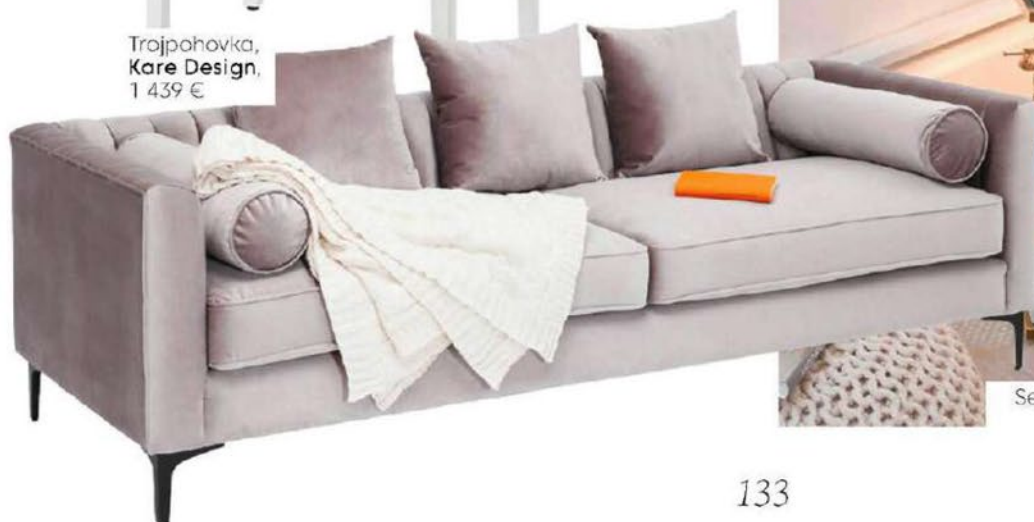
Trojpofovka, Kare Design, 1 439 €