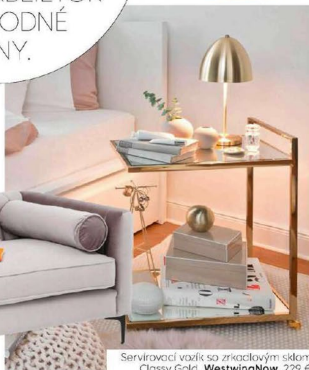
Servirovací vozík so zrkadlovým sklom Classy Gold, WestwingNow, 229 €