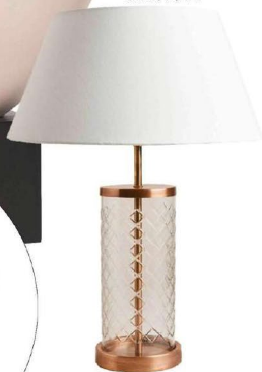
Lampa z brúseného skla, Zara Home, 99,99 €

AKO VYTVORIŤ PARIS CHIC? POTREBUJETE PÁR VINTAGE KÚSKOV, TROŠKU UMENIA, ŠTIPKU TRBLIETOK A PRÍRODNÉ TÓNY.