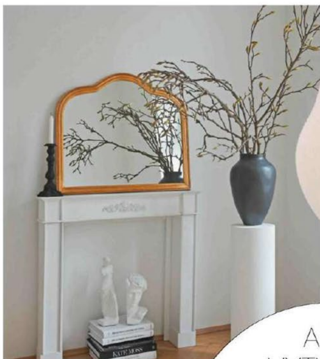
Nástenné zrkadlo Muriel, WestwingNow, 179 €