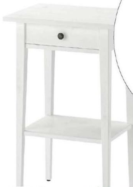
Nočný stolík Hemnes, IKEA, 49 €

AKO VYTVORIŤ PARIS CHIC? POTREBUJETE PÁR VINTAGE KÚSKOV, TROŠKU UMENIA, ŠTIPKU TRBLIETOK A PRÍRODNÉ TÓNY.