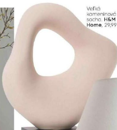
Veľká kameninová socha, H&M Home, 29,99 €