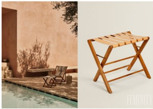
Dovolenka doma pri tom najkrajšom západe slnka