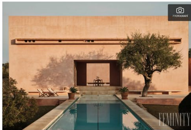
Bývanie pri západe slnka: Zlatá hodinka na vašej terase či záhrade, ktorú pomocou dekorácií premeníte na dovolenku

Užite si ten najkrajší západ slnka priamo na vašej terase či balkóne. Vďaka jednoduchým dekoráciám premeníte aj obyčajný priestor na dovolenku.