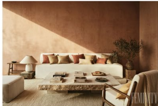
Užite si ten najkrajší západ slnka priamo na vašej terase či balkóne

Mohlo by vás zaujímať: Trendy v bývaní na rok 2021: Načerpajte inšpiráciu ešte pred zariadovaním a prerábaním vášho príbytku