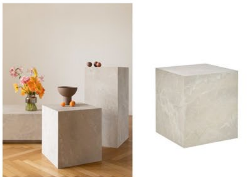
Retro Artsy čerpá z najlepších prvkov 60. rokov

Kolekcia Retro Artsy by Westwing, ktorá je zmesou retro štýlu a umeleckých prvkov, nás zavedie do sveta vyspelého dizajnu , ale so zábavným a zaujímavým nádychom. Čerpá zo všetkých najlepších prvkov interiérového dizajnu 60. rokov a pomocné stolíky v tomto neutrálnom prevedení môžete zakomponovať kdekoľvek v priestore, ešte pred vstupom na terasu. Nezabudnite na štýlovú vázu a kvety - oranžovo ružové odtiene sú must-have.