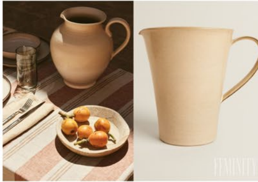
Nepravidelná kameninová súprava riadov

Návrat k tradíciám, remeslu a dedičstvu. Tak možno nazvať aktuálny trend, ktorý sa nesie viacerými odvetviami. Poctivá remeselná práca si zaslúži obdiv a uznanie. Nepravidelnosť tvarov riadov vnáša do stolovania na ľanovom obruse novú atmosféru. Nebojte sa kombinovať aj dva príbuzné štýly .