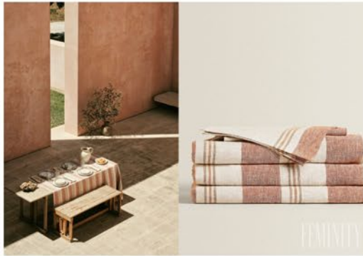
Blízkosť rodiny a priateľov sa stalo novým luxusom

Ľanový obrus je novodobým trendom v dekorovaní kuchyne, ktorý nesmie chýbať na žiadnom stole. Aj keď má prírodný charakter, v zápätí so sebou nesie istú stopu slávnosti. Nie však okázalej, ale prirodzenej pre našich predkov. Teplo domova a blízkosť rodiny či priateľov sa za posledný čas stalo akýmsi novým luxusom. Myslite na to pri stolovaní.