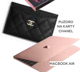
PUZDRO NA KARTY CHANEL

Áno, pred tým, ako som vytvorila Westwing, som pracovala ako novinárka pre prestížne magazíny. Veľa som pracovne cestovala po celom svete a zároveň objavovala krásne značky nábytku