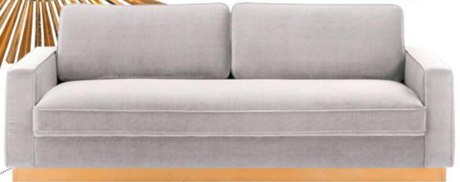
Zamatová pohovka Chelsea, Westwing Collection, 1 259 €