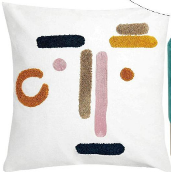
Obliečka na vankúš s výšivkou, Zara Home, 22,99 €