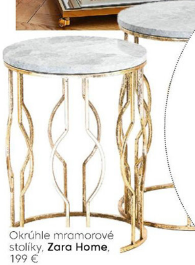
Okrúhle mramorové stolíky, Zara Home, 199 €