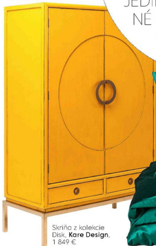
Skriňa z kolekcie Disk, Kare Design, 1 849 €