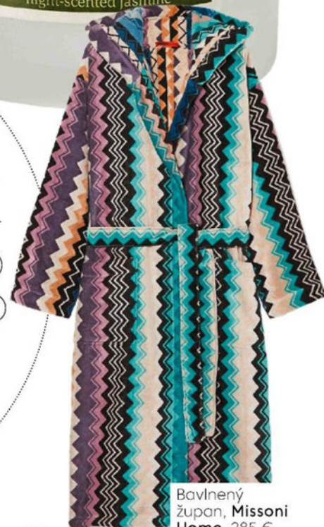
Bavlnený župan, Missoni Home, 285 €

MILOVNÍ- KOV EKLEKTIZMU MŮŽEME CHARAKTERI- ZOVAŤ AKO ĽUDÍ S PO- TREBOU PRINIESTĽ SI DO SVOJHO DOMU VŠETKO JEDINEČNÉ, VÝSTRED- NÉ A S UMELECKOU HODNOTOU .