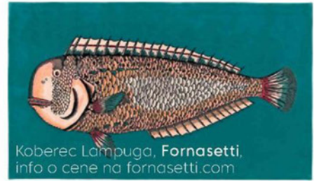
Koberiec Lampuga, Fornasetti, info o cene na fornasetti.com