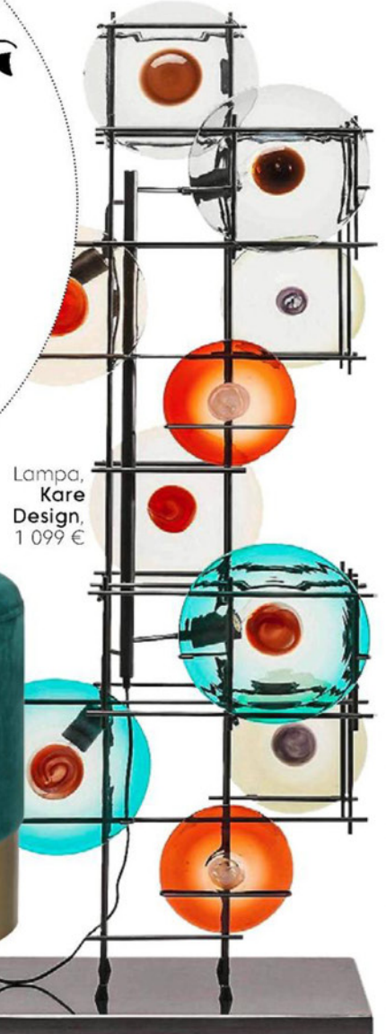
Lampa, Kare Design, 1 099 €

Spája staré a nové, jednoduché a extravagantné. Na prvý pohľad sa môže zdať, že v ňom kraluje kreatívny neporiadok, no jeho nadšenci vyberajú každý jeden kus plánovane a s citom.