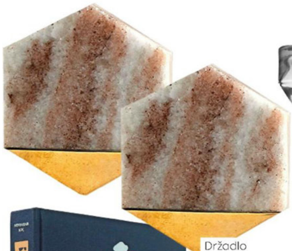
Držadlo z mramoru, Zara Home, 2ks 9,99 €