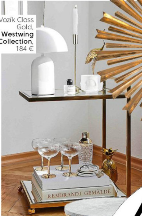
Vozík Class Gold, Westwing Collection, 184 €