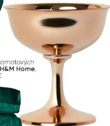
Kovová miska, H&M Home, 7,99 €