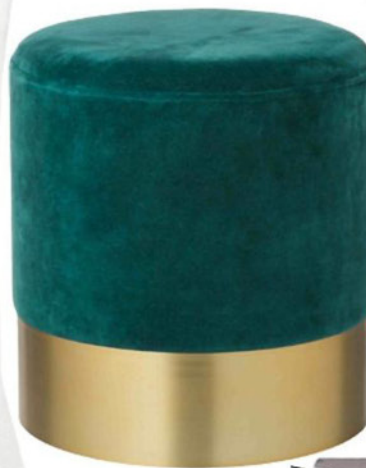
Zamatová taburetka Harlow, Westwing Collection, 109 €