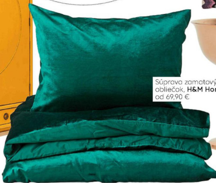
Súprava zamatových obliečok, H&M Home, od 69,90 €