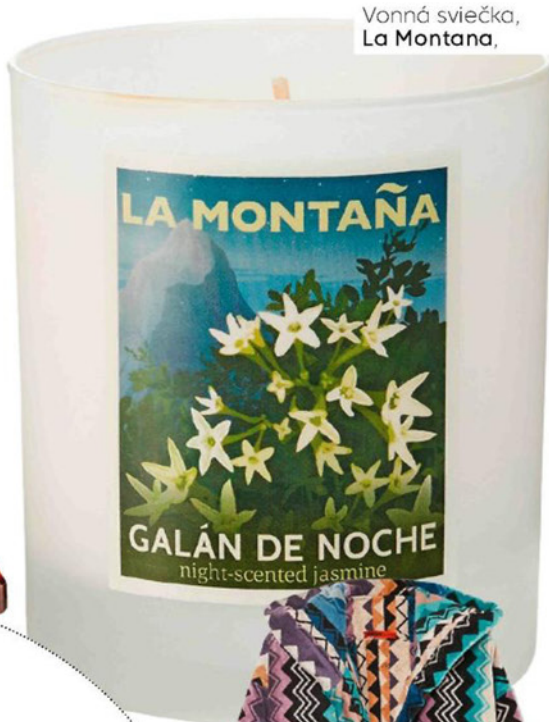
Vonná sviečka, La Montana,