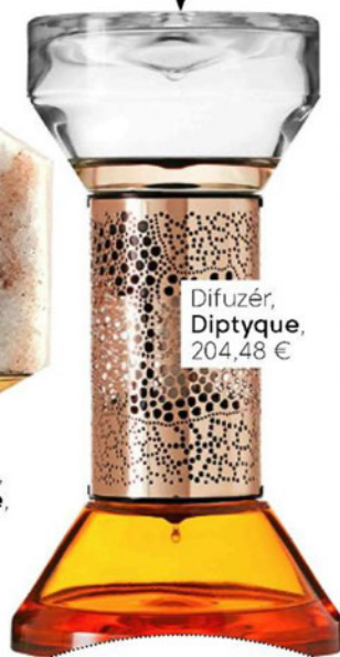
Difuzér, Diptyque, 204,48 €